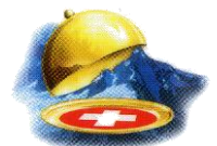
Ihr Gastgeber-Team Iwan Iten

... mit Aussicht geniessen Alle Preise inkl. 7.7% MwSt.